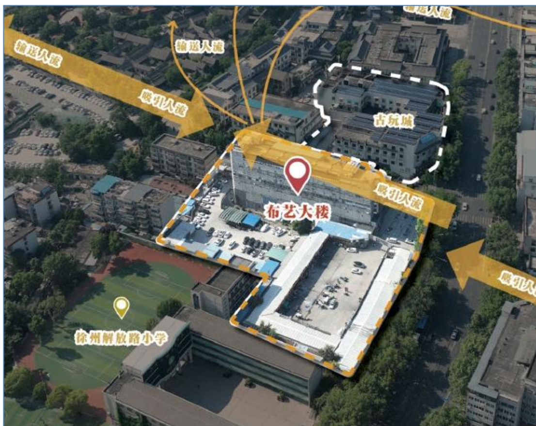
物华地块及物华大厦现状图