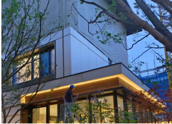
立面广告包封参考示意

因全维实景示范区展示需要，需提前安装满足展示所需正式电梯，因正式电梯作为展示销售电梯使用所涉及的拆改、二次调试验收、维保、年检等费用包含在电梯供货安装费用总价中。室内电梯需提前安装，并在井道内增加临时机房层（含结构封板，位置及数量同精装样板房布置），保证室内电梯使用，交付前室内电梯拆改工作及临时机房层拆除及清理工作由承包人负责，所产生的费用由承包人综合考虑报价中。