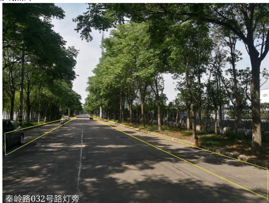
图 2-1 秦岭路 032 号路灯旁道路两侧禁止停车区域抓拍区域