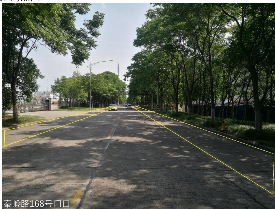
图 1-1 秦岭路 168 号门口道路两侧禁止停车区域抓拍区域