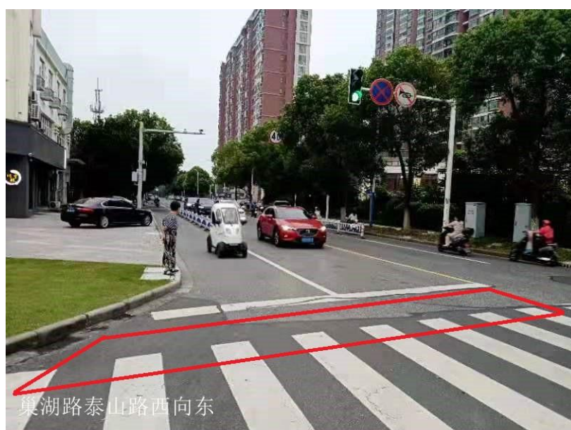
图 1-4 巢湖路泰山路西向东混合车道及非机动车道抓拍区域