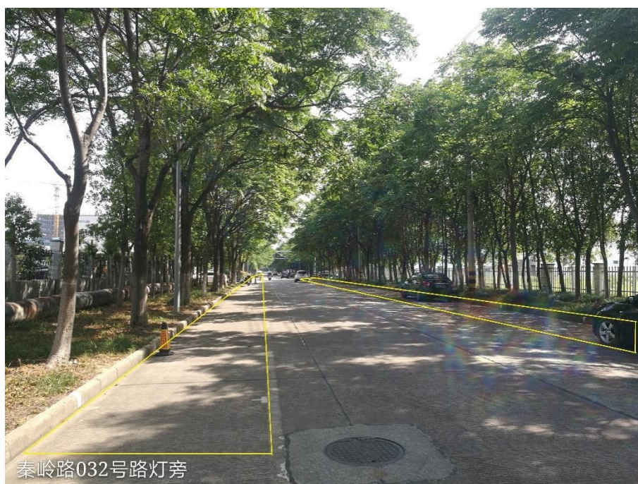
图 2-2 秦岭路 032 号路灯旁道路两侧禁止停车区域抓拍区域

（四）路口监控点位踏勘参照新建违停抓拍点位样例；不礼让行人抓拍、电子哨兵点位踏勘参照高清人车卡口点位样例；炸街车抓拍、右转必停点位踏勘参照高清电子警察点位样例。