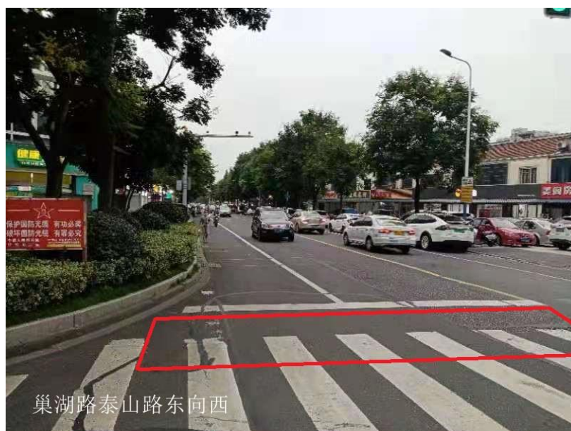
图 1-3 巢湖路泰山路东向西混合车道及非机动车道抓拍区域