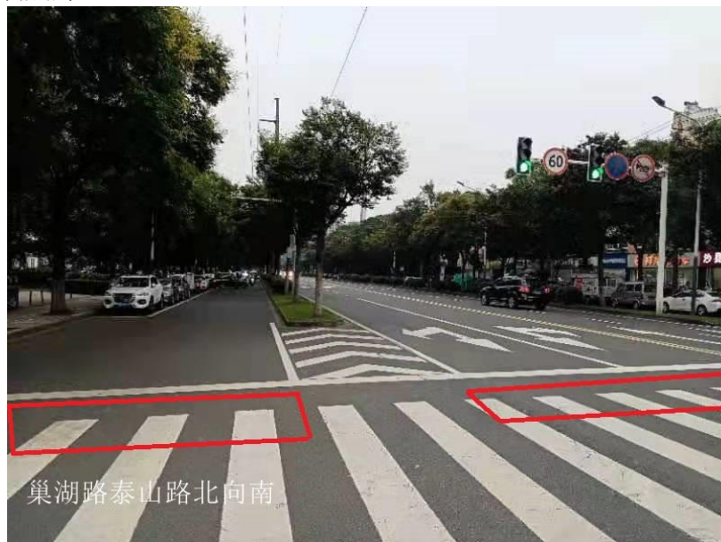
图 1-1 巢湖路泰山路北向南机动车道及非机动车道抓拍区域