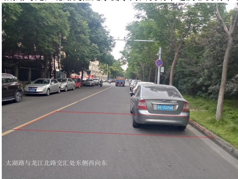
图 1-2 太湖路与龙江北路交汇处东侧西向东机动车道及非机动车道抓拍区域