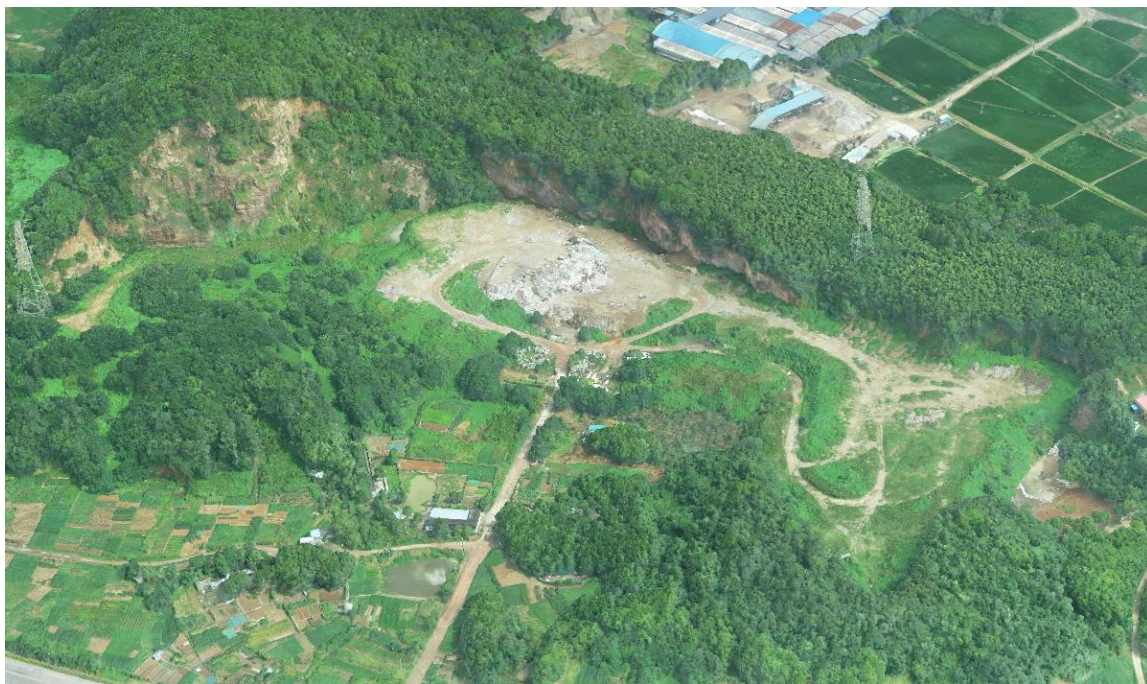
凤凰山南宕口全貌

宕口边坡整体北西高南东低，北侧最高约 75m，向南侧逐渐过渡至 15m。宕口为一墙式开采，边坡较陡，整体坡度约 60° -70°，局部近直立。边坡岩性为砂岩，产状为 169° ∠30°，岩石节理裂隙较发育，测得二组节理面产状为 210° ∠50°、250° ∠80°。边坡岩石裸露，自然复绿整体较差，局部生长有少量的灌木和杂草。