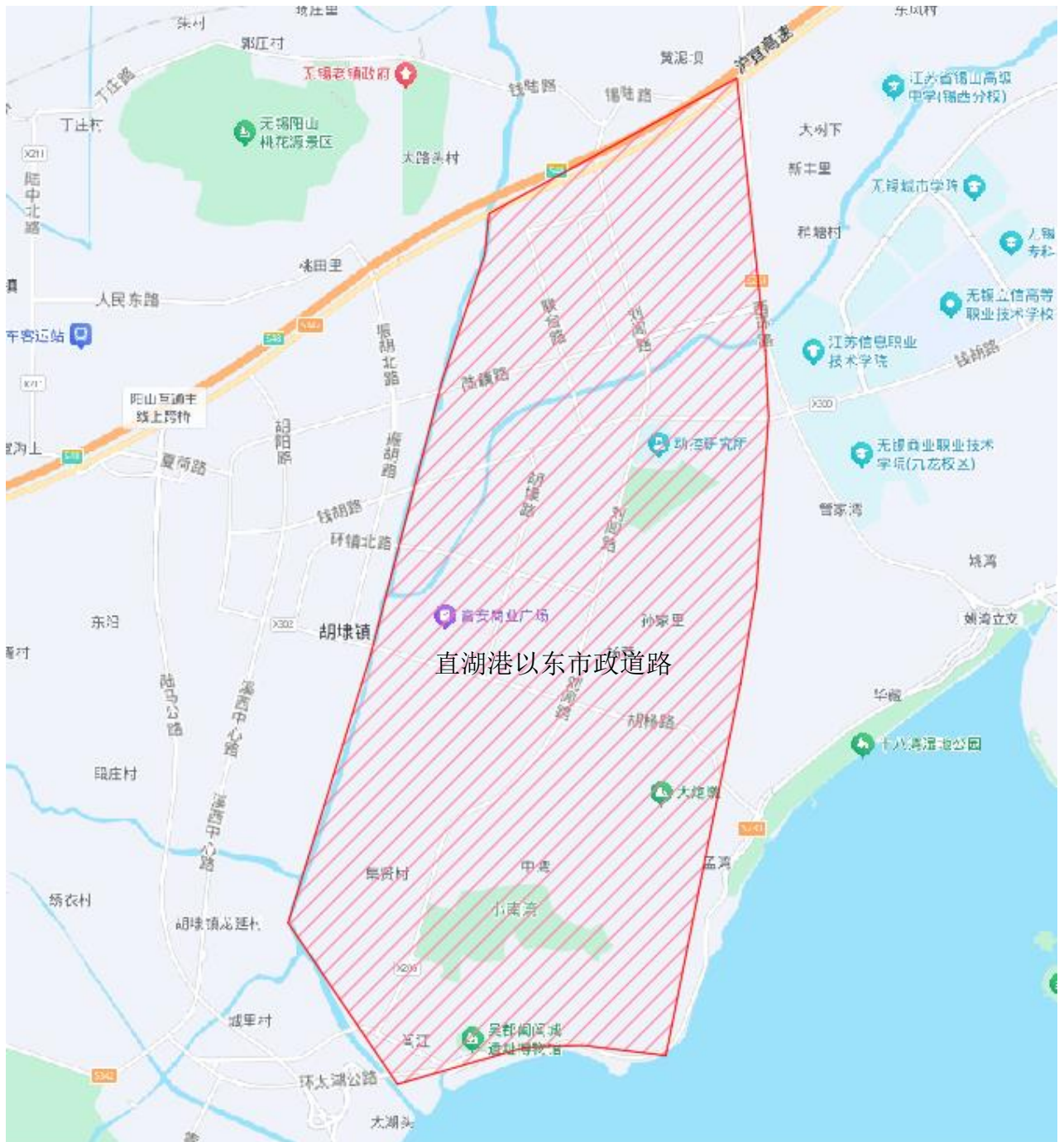
图5-4 直湖港以东市政道路位置图