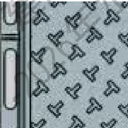
图单眼双眼三眼 球墨铸铁井盖面防滑花纹