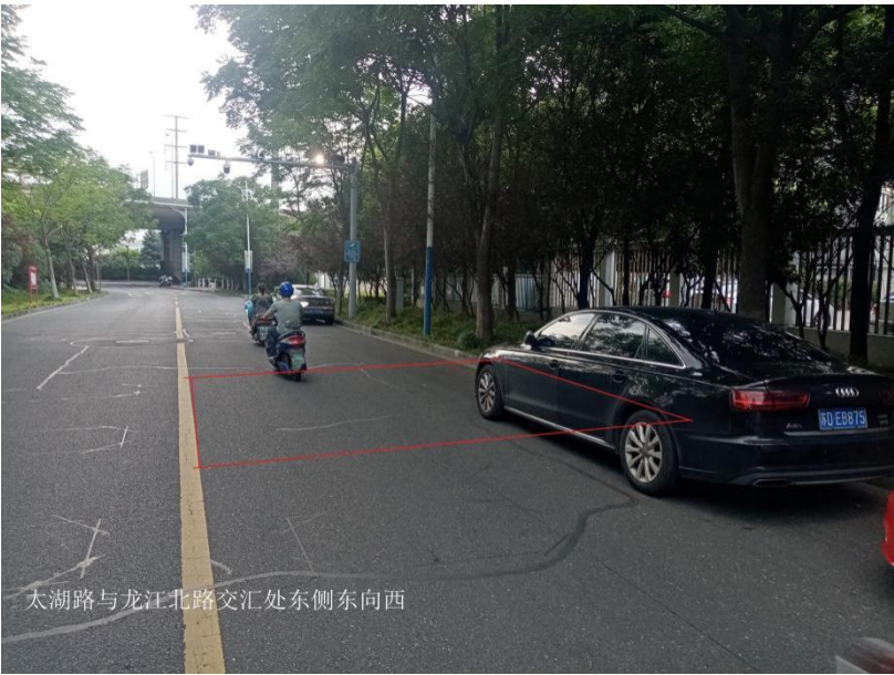
图 1-1 太湖路与龙江北路交汇处东侧东向西机动车道及非机动车道抓拍区域

注：类型、点位名称、点位编号、经纬度、安装方式、设备类型、通讯、监控/抓拍区域和主要监控目标对象依据“建设点位清单”信息进行填写，注意事项依据“建设点位清单”备注栏里的信息以及现场踏勘情况进行填写。