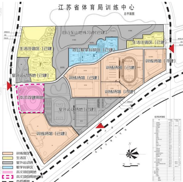
图 1-1-1 项目区位图