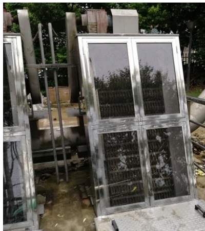
格栅自封闭罩样例

格栅除臭罩：现场定制（1）格栅前部密封处理，该部位边框结构用 2mm304 不锈钢板折成相应形状和格栅本体固定，间距需充分考虑格栅运行的稳定性，结合面需做密封处理，固定方式采用可拆卸螺栓固定，门窗采用可对开可视门进行安装，门体采用 304 不锈钢方管（50*50*2mm）加防紫外可视板，这部分密封需结合现场实际便于清洁和增加人员防跌落安全性。（2）格栅侧面轴承座密封处理，该部位采用 2mm304 不锈钢剪成相应形状进行覆盖。（3）格栅底部密封处理，底部采用一块 2mm304 平板遮盖粗格栅与地面之间的空隙。（4）格栅后部采用高度适中的 2mm304 不锈钢板剪成相符形状后进行焊接密闭处理。（5）压榨机密封处理，压榨机与格栅连接处密封采用 2mm304 不锈钢板折成相应形状后采用铰链加插销的安装形式。此部分连接强度需另外加强，需充分考虑到垃圾外溢所造成的变形影响。（6）压榨机侧面盖板密封处理采用 2mm304 不锈钢板折成相应形状后采用铰链加插销的安装形式。上述所有铰链均采用可脱卸的不锈钢 304 铰链。经过改装后格栅和压榨机外表面各连接处平整，连接平滑到位，无明显漏气，各密封件均可轻易拆卸和恢复安装。为减少腐蚀，格栅主要部件均不得密封在格栅罩内。以上所有部件均采用不锈钢 304 材质，厚度实测不小于 2mm，均需现场定制，同时需满足运行部门提出的其他特殊的定制要求。